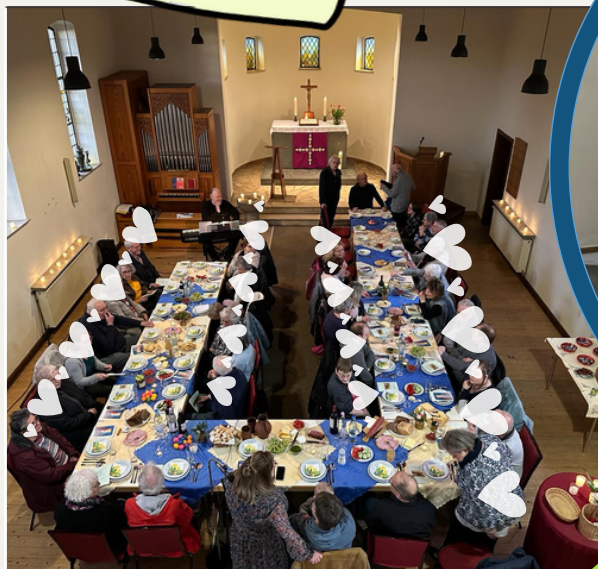
TISCHABENDMAHL AM GRÜNDONNERSTAG IN DER GNADENKIRCHE