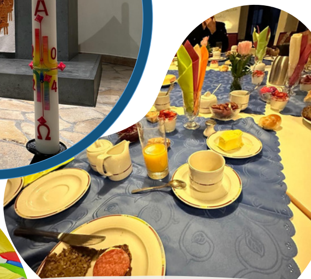
OSTERFRÜHGOTTESDIENST MIT FRÜHSTÜCK IN DER GNADENKIRCHE