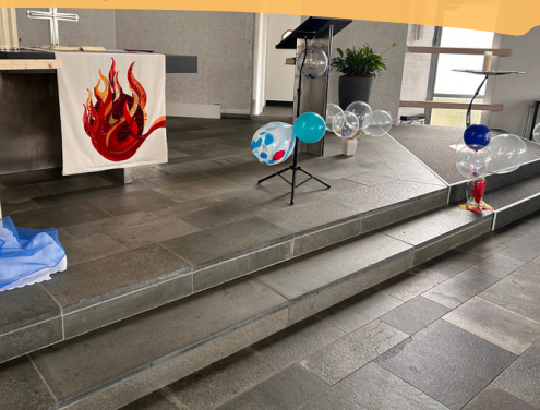
FAMILIENGOTTESDIENST MIT ANSCHLIEßENDER EIERSUCHE UND WÜRSTCHEN IN DER KREUZKIRCHE